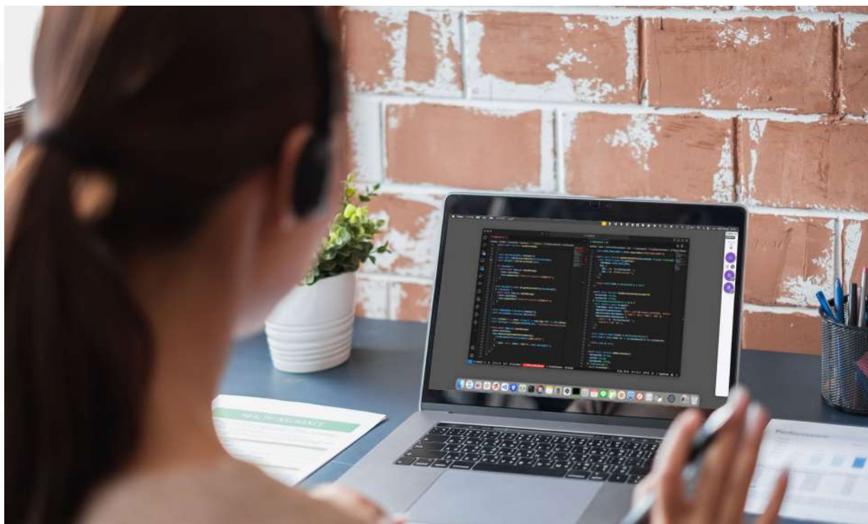
リモート中のコミュニケーションの潤滑油となり、チームビルディングや新人の育成にも役立つ助っ人ツール